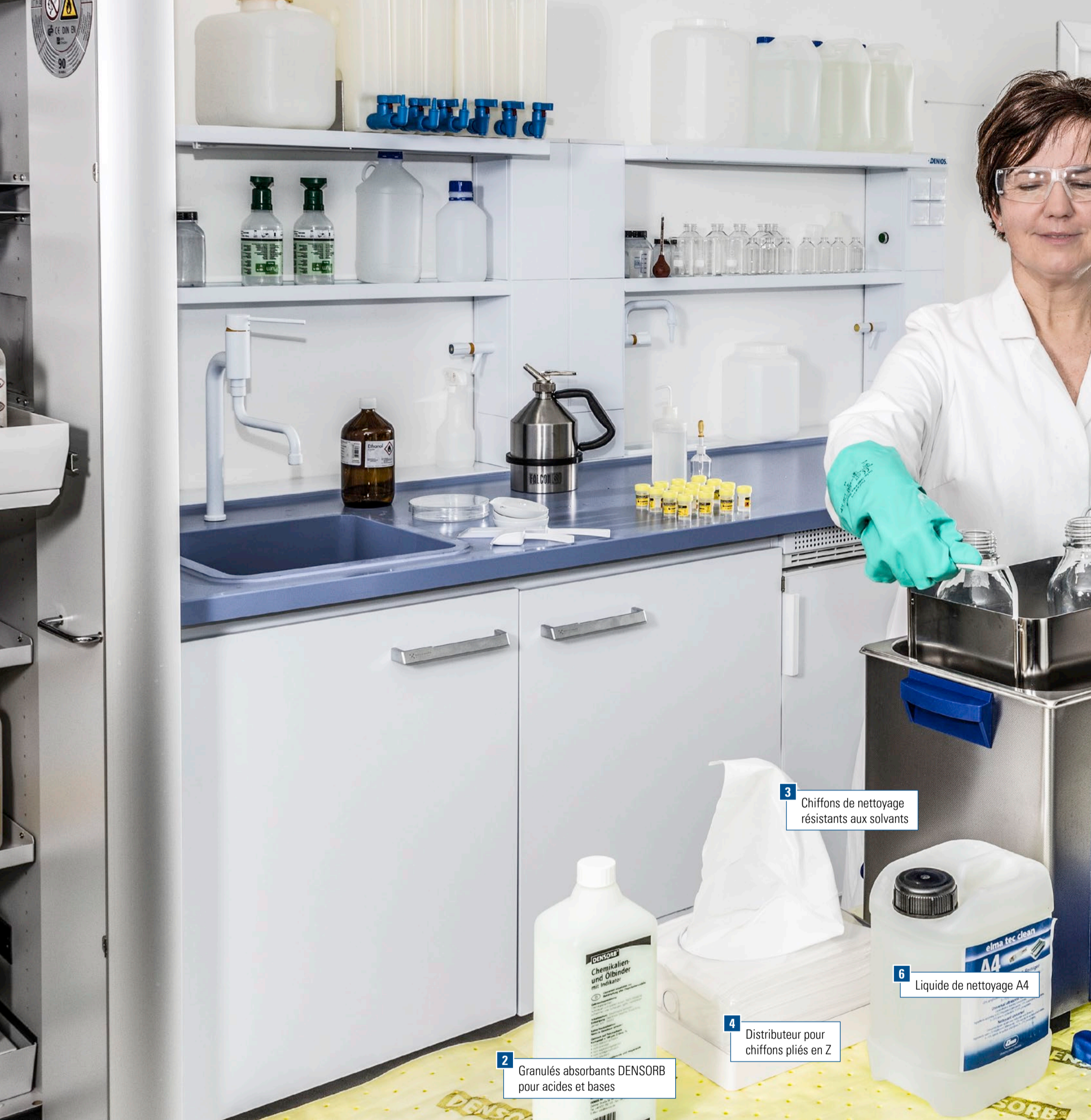
3 Chiffons de nettoyage résistants aux solvants