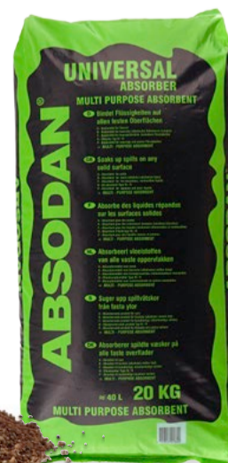
5 Granulés absorbants

5 Granulés absorbants Universel, Absodan SuperPlus, version Universel, sans COV, 20 kg, Volume d'absorption : 16 litres / UV, Code art. 256-705-0D, 34,50 € / pièce 31,50 € / pièce à partir de 10 unités