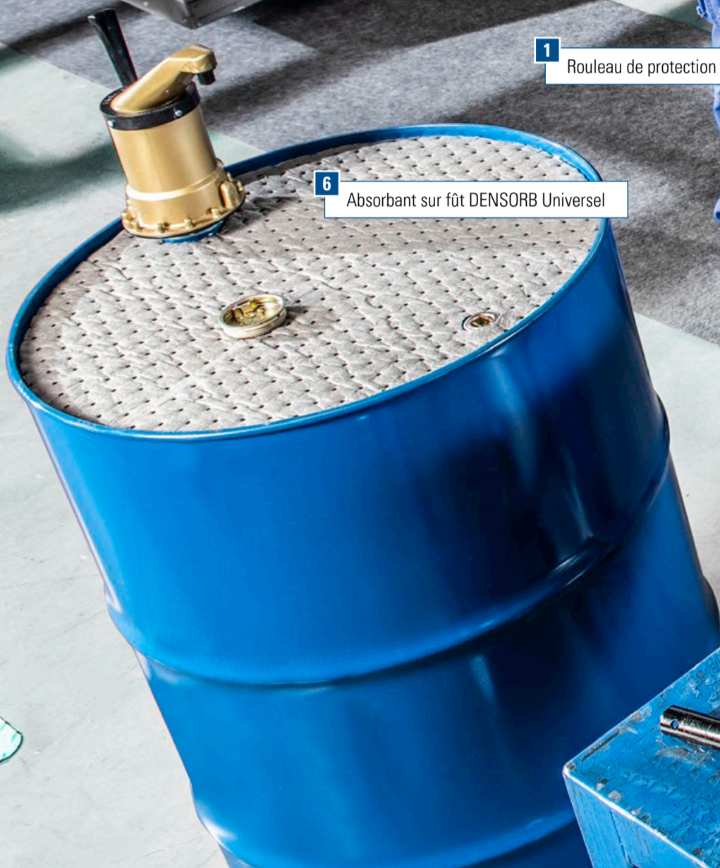
6 Absorbant sur fût DENSORB Universel