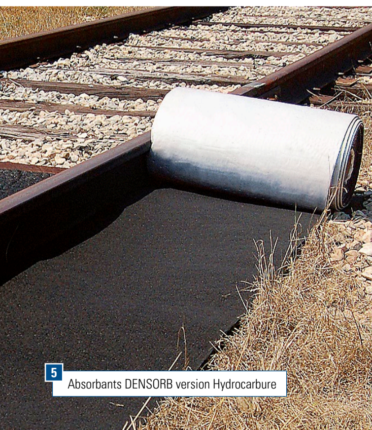
5 Absorbants DENSORB version Hydrocarbure