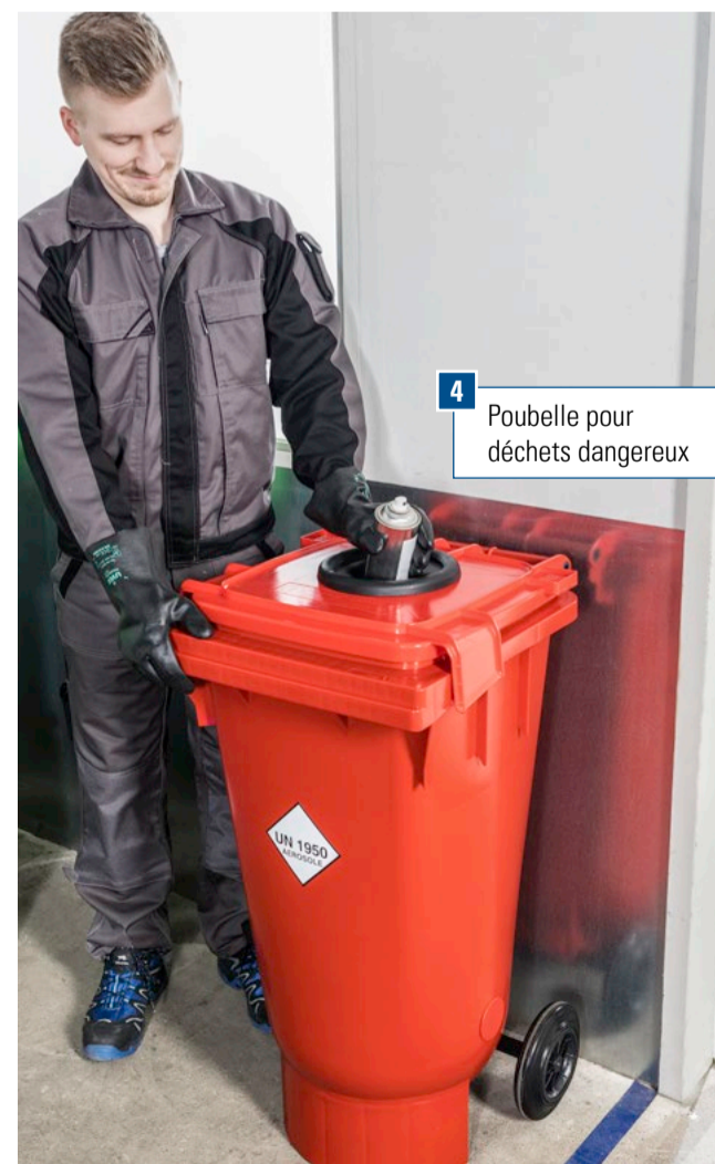
4 Poubelle pour déchets dangereux

6 Poubelle pour déchets solides et dangereux, avec certification UN, volume de 200 litres, Code art. 271-885-OD, 203 €