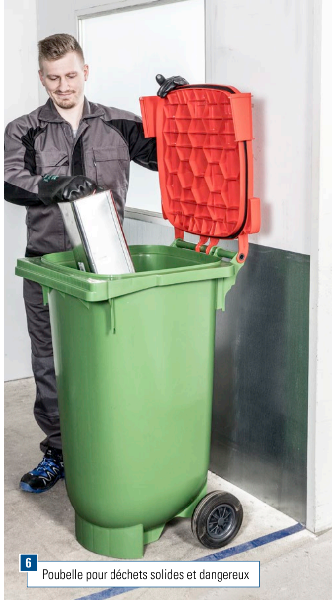
6 Poubelle pour déchets solides et dangereux