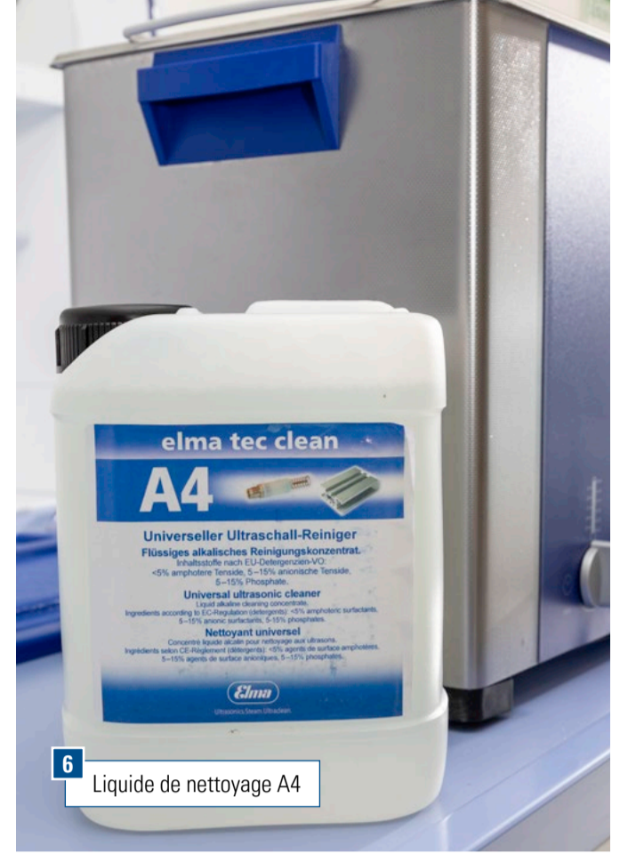
6 Liquide de nettoyage A4