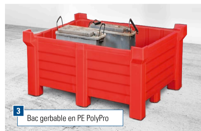
3 Bac gerbable en PE PolyPro