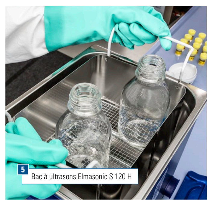
5 Bac à ultrasons Elmasonic S 120 H