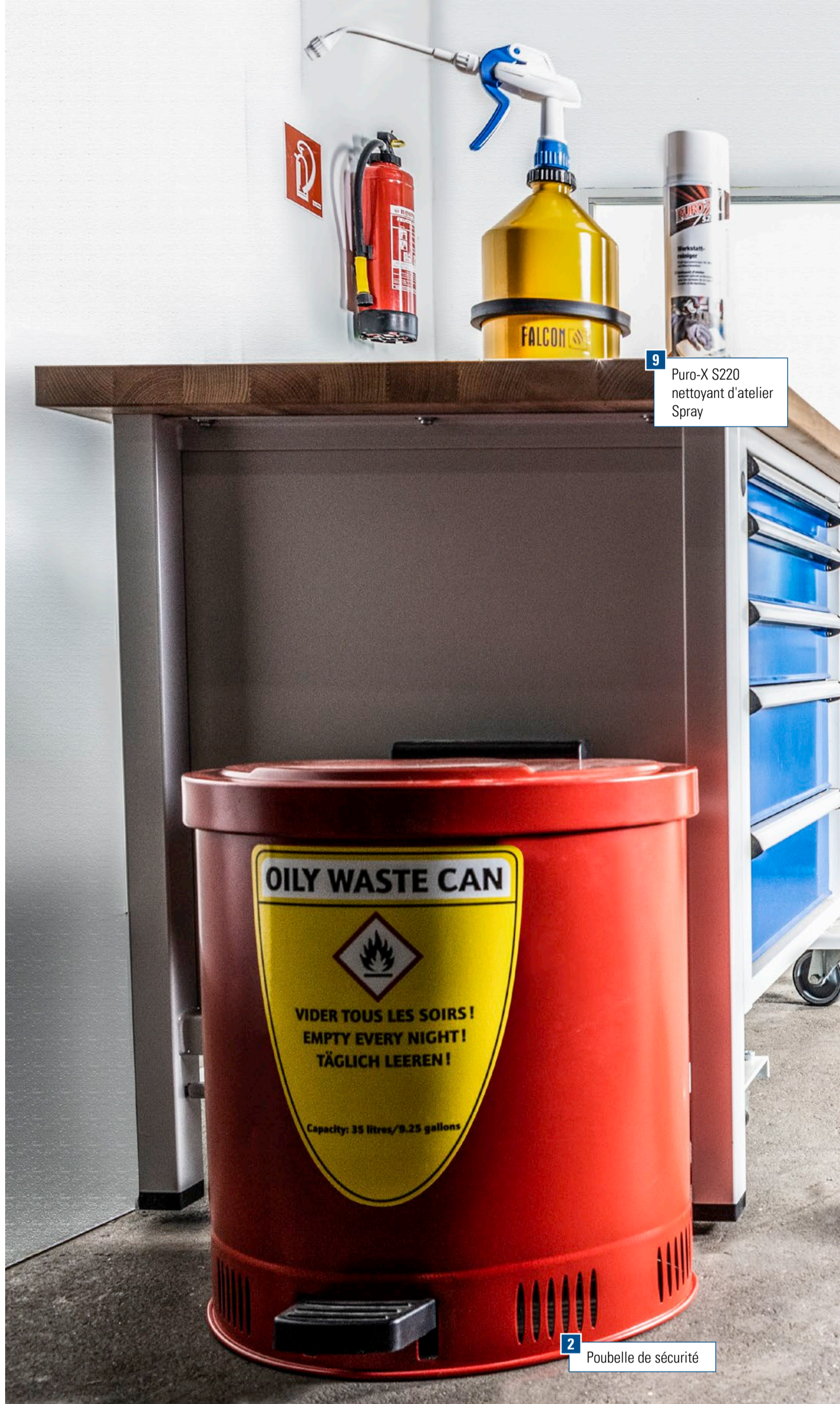
9 Puro-X S220 nettoyant d'atelier Spray