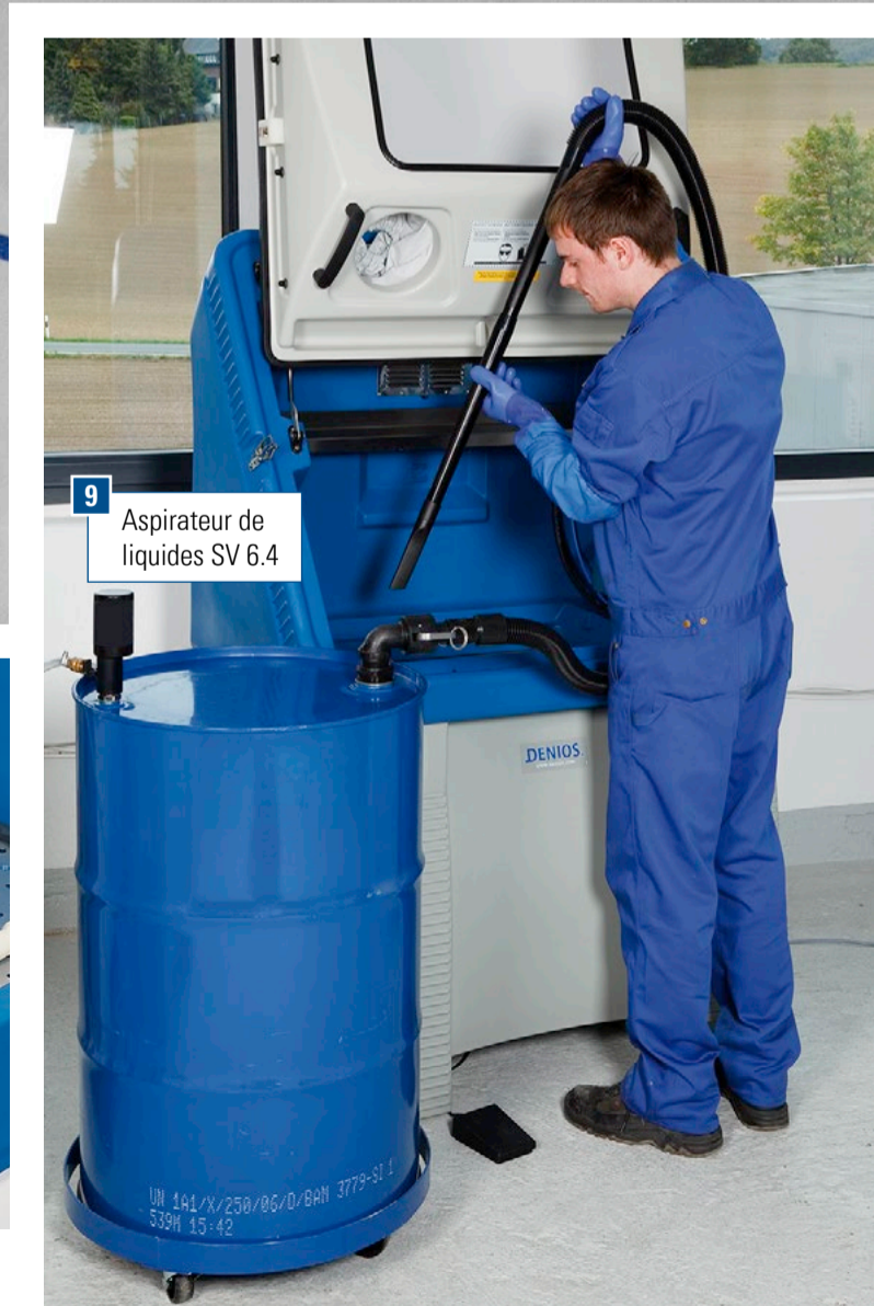
9 Aspirateur de liquides SV 6.4