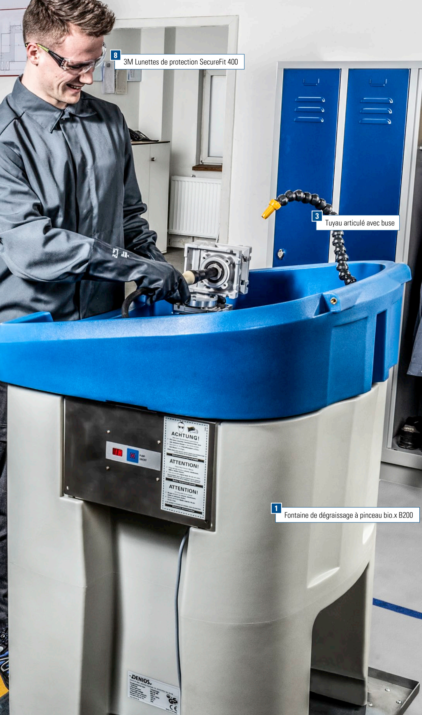
8 3M Lunettes de protection SecureFit 400