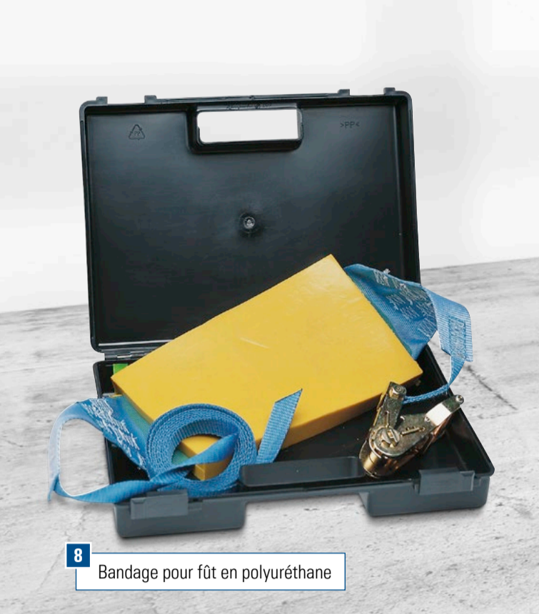
8 Bandage pour fût en polyuréthane