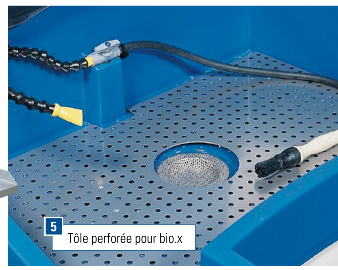
5 Tôle perforée pour bio.x