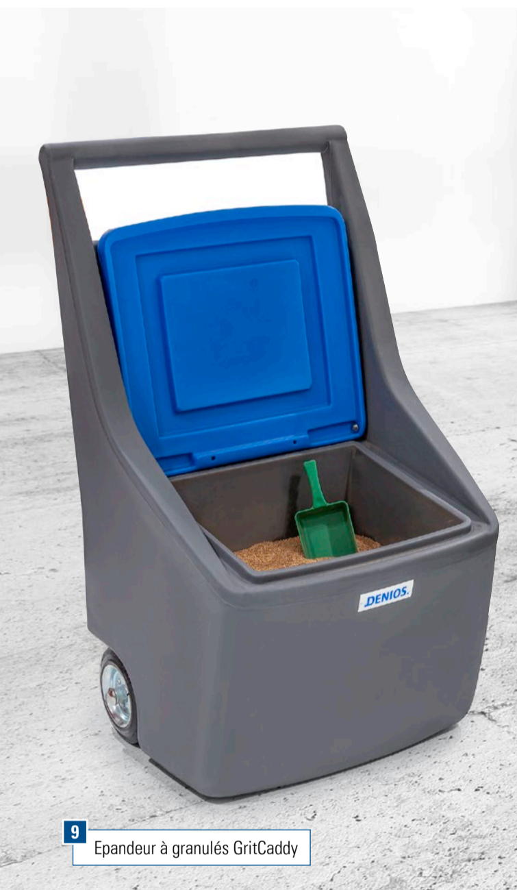
9 Epaneur à granulés GritCaddy