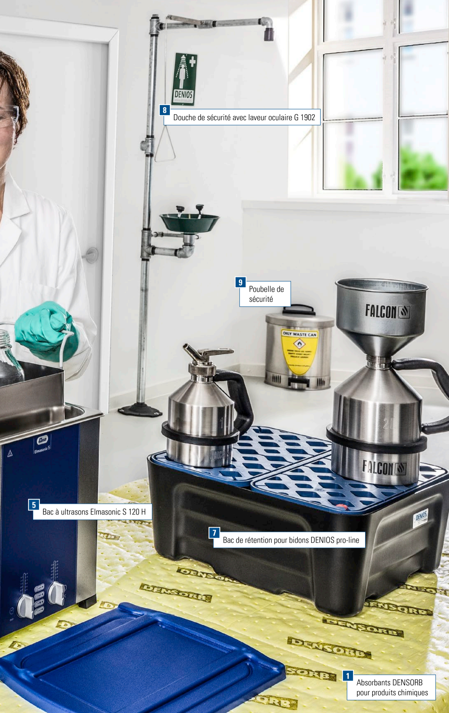
8 Douche de sécurité avec laveur oculaire G 1902