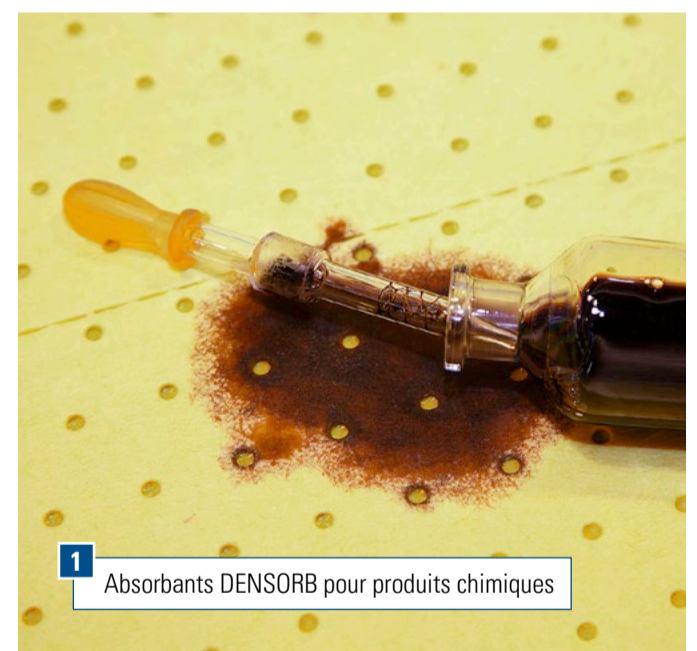
1 Absorbants DENSORB pour produits chimiques

1 Absorbants DENSORB pour produits chimiques, en rouleau, Economy Double, heavy, 2 couches, L x P (m) : 10 cm x 45 m, Code art. 243-818-OD, 142 € / paquet 135 € / paquet à partir de 3 paquets