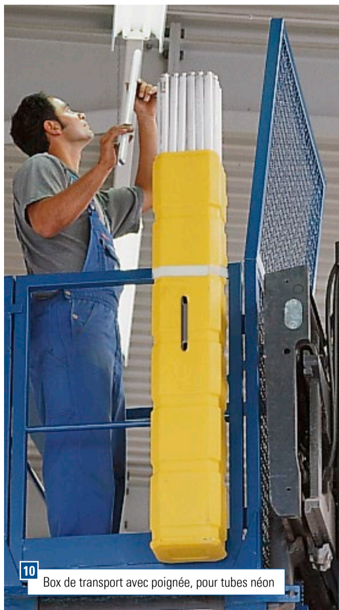
10 Box de transport avec poignée, pour tubes néon