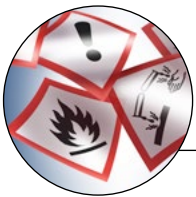
Les 9 dangers SGH