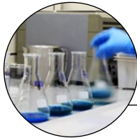
Mélanges et stockage