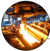
Les feux de métaux