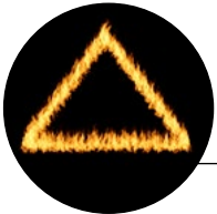
Le triangle du feu